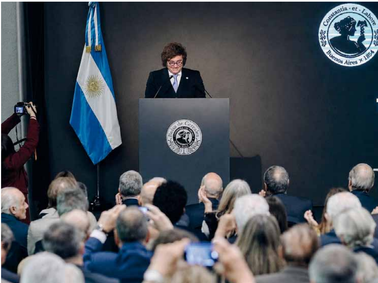
El mandatario destacó que buscan terminar con "el calvario" de que el país dependa exclusivamente del sector agropecuario.