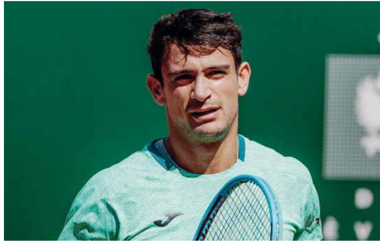
Contundente. El tenista argentino tuvo una actuación brillante y aplastó a su rival.

El argentino, que este año ganó su primer título al imponerse en el ATP 250 de Bucarest, logró meterse entre los cuatro mejores de este torneo que se juega en tierras suizas y que se lleva a cabo en la semana