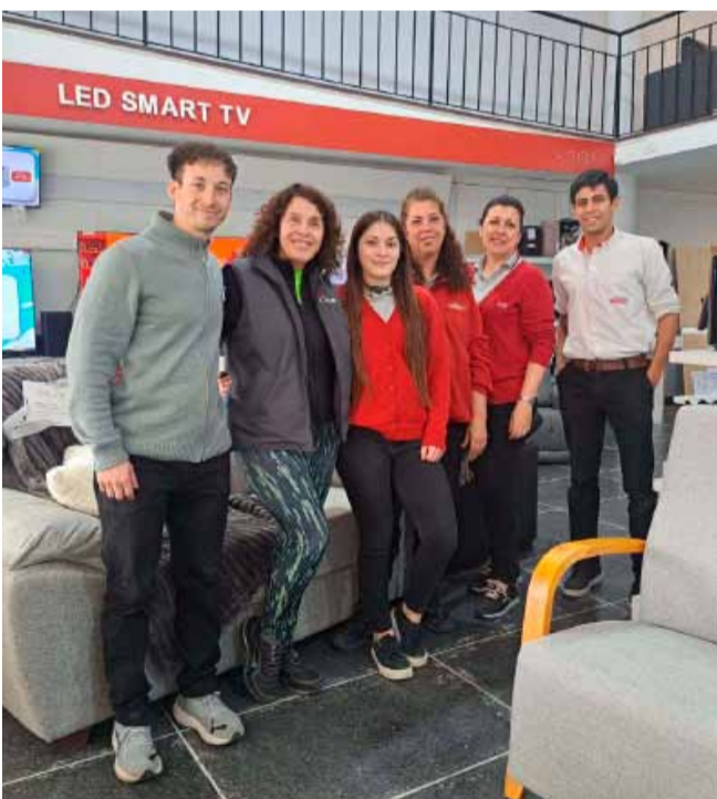
El equipo de Casa Silvia, completo.