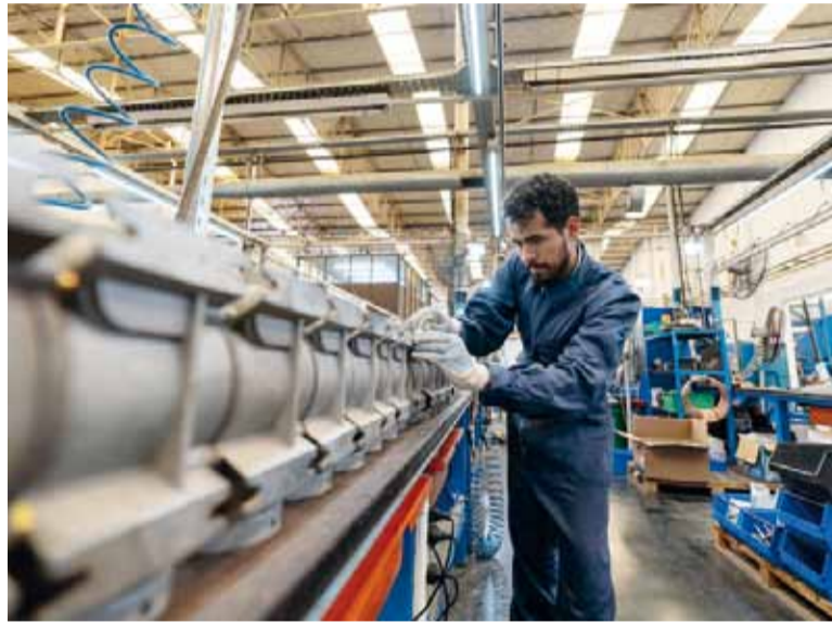
En verde. En el acumulado del primer trimestre, el EMAE exhibió un incremento de 1,7%.

de los quince sectores de actividad que componen el indicador registraron subas en la comparación interanual. Entre los rubros con mayores incrementos se destacaron Pesca, con una variación de 30,9%, y Agricultura, ganadería, caza y silvicultura, con un alza de 17,9%. La actividad de Agricultura, ganadería, caza y silvicultura fue la de mayor incidencia positiva en la variación interanual, seguida por Industria manufacturera, que creció 4,6%, y Explotación de minas y canteras, con un aumento de 16,3%. En conjunto, estos sectores aportaron 2,7 puntos porcentuales al crecimiento interanual