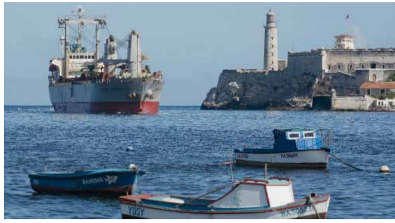
Ayuda humanitaria. La isla atraviesa una crítica situación y Trump dijo que desea ayudar a los ciudadanos cubanos.

El anuncio del despliegue del USS Nimitz se produjo prácticamente en simultáneo con una decisión que elevó el conflicto diplomático: el Departamento de Justicia estadounidense imputó