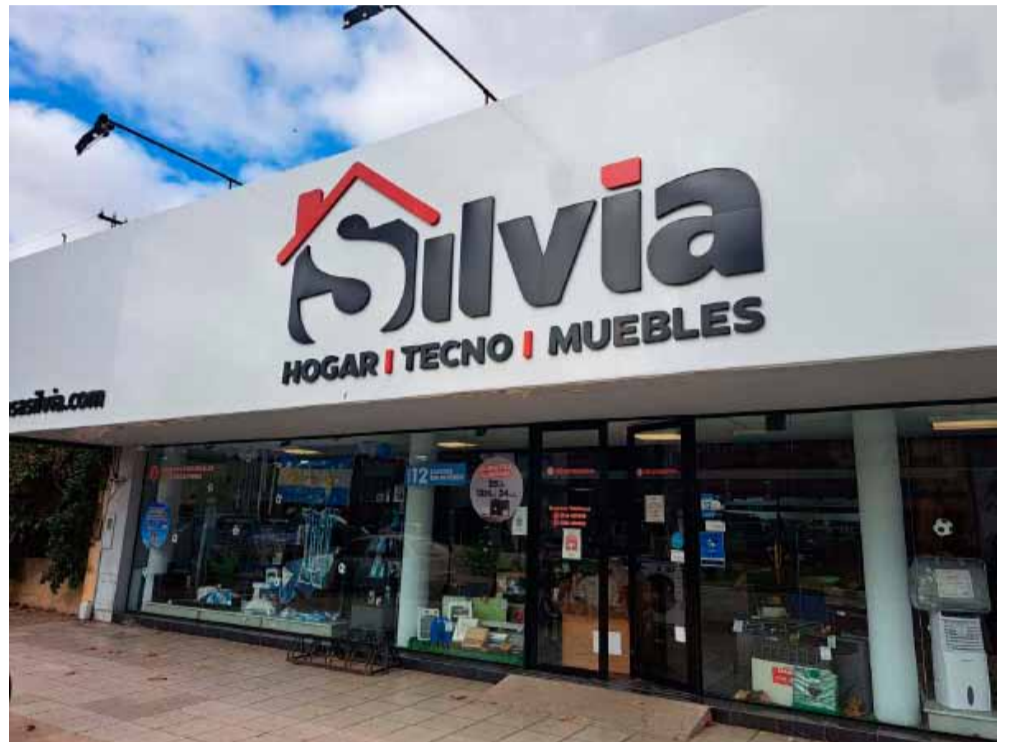
Nuevo logo de Casa Silvia. La renovación parte desde allí. Puertas adentro de Lavalle 174, todo estará en otro orden y respondiendo a criterios estéticos muy cuidados.

Ambos se encargaron de remarcar que el servicio, la puesta a disposición del cliente, es uno de los valores irrenunciables de la empresa que representan. Por ello la experiencia de compra siempre va precedida del consejo adecuado y finaliza con el servicio de post venta, dispuesto permanentemente a la solución directa de cualquier inconveniente que pudiera surgir. "Los productos vienen embalados de fábrica y se abren en el domicilio del comprador. De modo que ante un eventual problema, nosotros lo resolvemos en forma directa. Es decir que cualquier falla o defecto de fábrica nos encargamos de atenderlo sin que el cliente deba recurrir a ningún otro actor", dijeron casi al unísono. Y otro punto destacable es el sistema de financiación propia. "No somos una financiera, nuestro sistema de financiación está