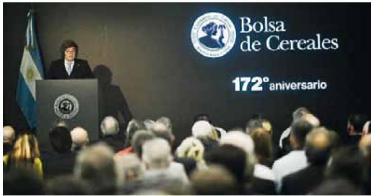
El discurso. Javier Milei, ayer, en el 172° aniversario de la Bolsa de Cereales de Buenos Aires.