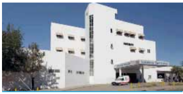
El exsanatorio San Carlos.

Condenado por contagios y muertes en la pandemia