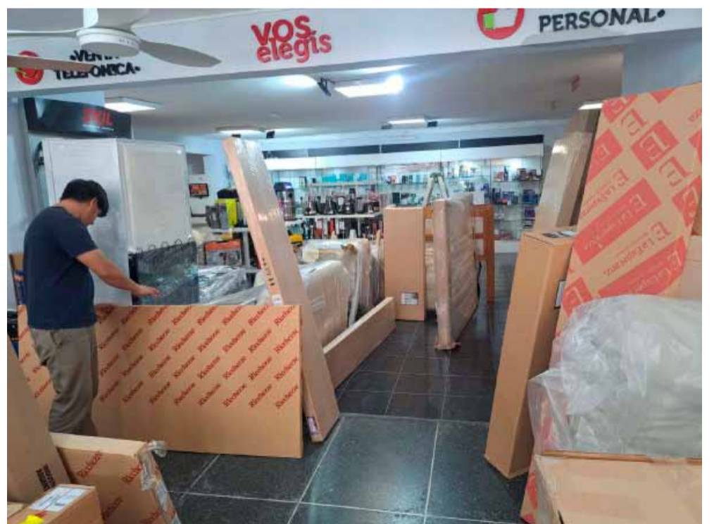
A desembalar. Intenso movimiento en el local de Casa Silvia. Llegó una importante cantidad de mercadería que ya estará en exhibición y venta.

CORREO ARGENTINO 6550 BOLIVAR FRANQUEO PAGADO Concesión N° 60/Dto. 3c. TARIFA REDUCIDA Concesión