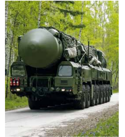
El traslado un misil Yars en medio de las maniobras militares.

Camiones con misiles balísticos intercontinentales retumbaron por caminos forestales, submarinos de propulsión nuclear zarparon de puertos del Ártico y del Pacífico, y tripulaciones subieron a aviones de guerra mientras Rusia y la vecina Bielorrusia realizaron ayer la etapa final de sus ejercicios nucleares conjuntos.